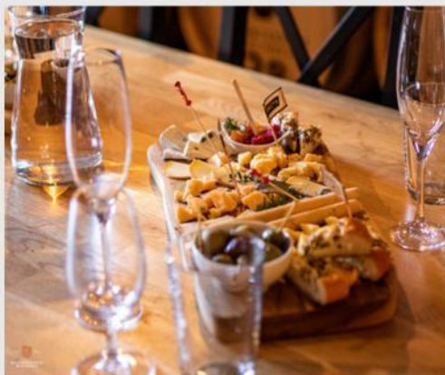
WINO I ENOTURYSTYKA