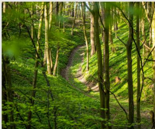
SZLAKI PIESZE I ROWEROWE