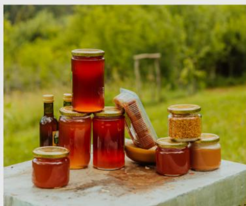
TRADYCYJNE WYROBY MIODOWE

Lubelszczyzna słynie z wyjątkowych dań, które łączą tradycje polskiej, żydowskiej i ukraińskiej kuchni .