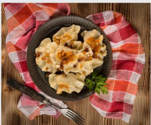
PIEROGI Z KASZĄ GRYCZANĄ