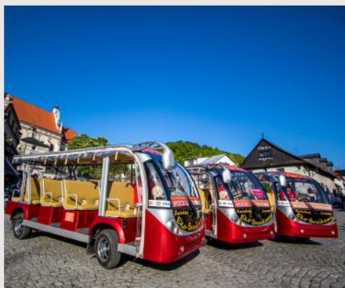
EKO BUSIKI ORAZ ZWIEDZANIE Z POCHODNIAMI

Lubelszczyzna to także doskonałe miejsce na aktywny wypoczynek.